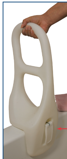
Artículo # 12044