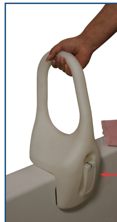
Artículo # 12039

Por favor tenga extremo cuidado cuando haga la instalación en bañeras de fibra de vidrio. NO AJUSTE EN EXCESO ya que la grampa puede romper la fibra de vidrio.