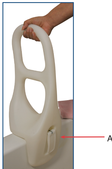
Article # 12044